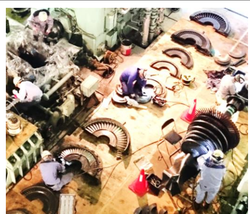
蒸気タービンを分解

江戸川清掃工場では安全で安定した操業のため、毎年4月から6月に定期点検（オーバーホール）を実施しています。毎日800℃以上の高温でゴミを燃やし続ける焼却炉、熱を有効利用するための設備、公害を防止するための設備など様々な部分を分解し、点検と補修を行います。ゴミ搬入への影響を少なくするため、2つある焼却炉は期間をずらして停止しますが、共通部分もあるため2炉とも停止する期間があります。今年度はこの全炉停止期間に、4年に1度実施する蒸気タービンの開放点検を行いました。