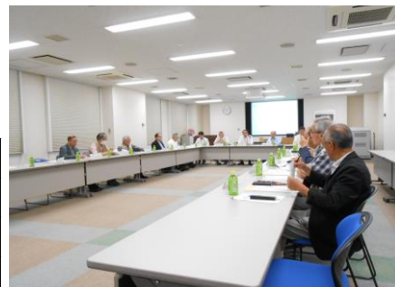
運営協議会の様子

URL: http://www.union.tokyo23-seisou.lg.jp/kojo/itabashi/index.html