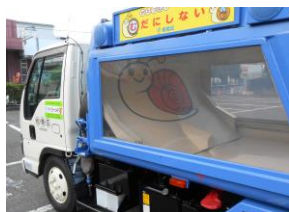
スケルトン清掃車