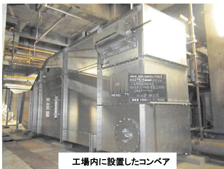
工場内に設置したコンベア