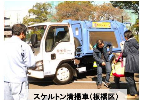
スケルトン清掃車(板橋区)