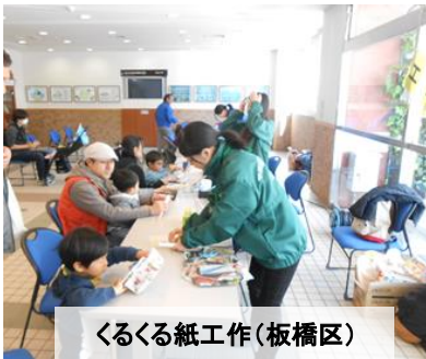
くるくる紙工作(板橋区)