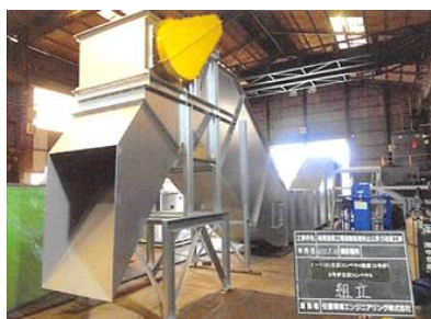
製造中のコンベア