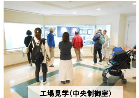
工場見学(中央制御室)