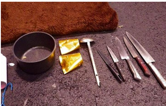
清掃一組の搬入物検査で見つかった不適性搬入物