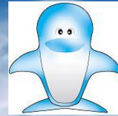
新江東清掃工場 シンボルマスコット 「ルイ」

http://www.union.tokyo23-seisou.lg.jp/kojo/shinkoto/index.html