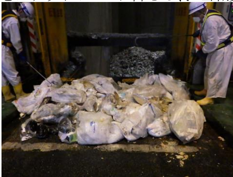
降ろしたごみの搬入物検査の様子

東京二十三区清掃一部事務組合では本年7月11日から15日までを「搬入物検査強化週間」とし、不適正搬入防止のため、当工場でも、搬入物検査を実施しました。「搬入物検査」とは、ごみ収集車が集めてきたごみをプラットホームに降ろし、担当職員がごみの中に不適正搬入物が混じっていないかどうかを検査する作業です。当工場では、引き続き、不適正搬入防止に向けて取り組んでまいります。