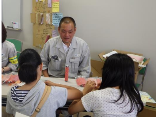
熱心な参加者の様子

※ごみ運搬自動車伝票：工場に搬入した清掃車がどのくらいのごみ量を持ち込んだか記録し、お知らせする用紙