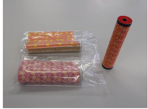
廃材を再利用した万華鏡の材料と完成品