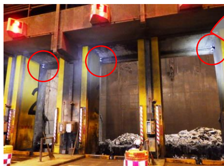
ごみバンカゲートに設置した監視カメラ

当工場では、ごみの不適正搬入を防止するために、搬入車両への啓発チラシの配布や搬入物検査などを実施しています。更に監視カメラを全てのごみバンカゲートに設置し、監視を強化しています。監視カメラでは、搬入時間や車種、排出されたごみなどを確認することができます。