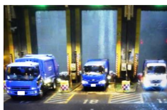
記録された監視カメラの映像