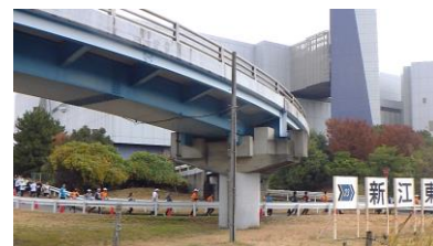
専用道路を走るランナーたち