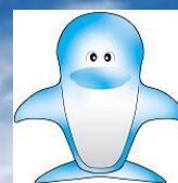
新江東清掃工場 シンボルマスコット 「ルイ」

令和6年3月22日 東京二十三区清掃一部事務組合 新江東清掃工場 江東区夢の島3-1-1 電話：03-5569-5341（代）