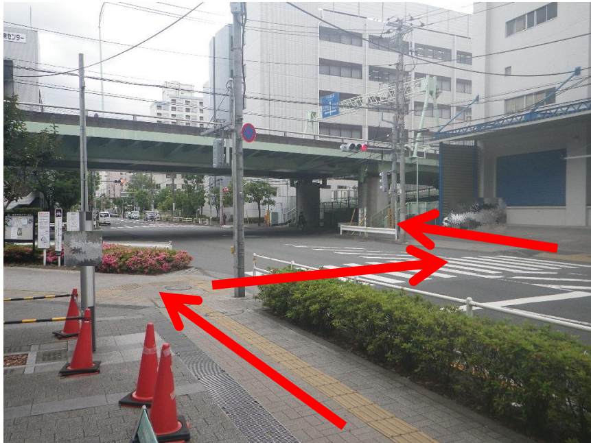
①「品川シーサイド駅」A出口を出てT字路まで進み、信号を渡って少し進みます。