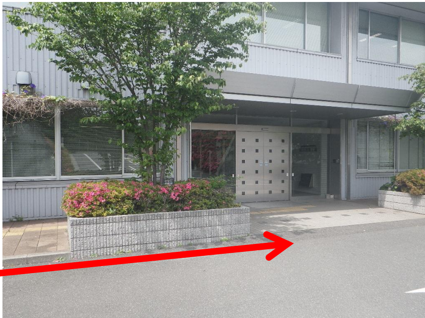
⑧ 管理棟の入り口に到着します。見学者説明室は2階です。