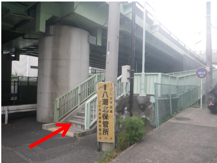
②信号の先の階段を上って直進します。