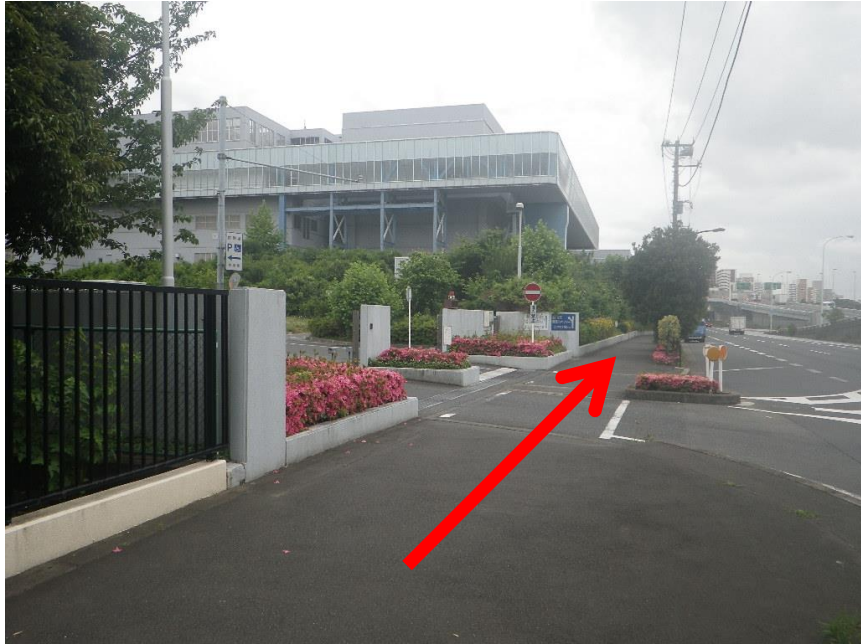
⑤先に進むと車両の入り口が見えますが、通用門はさらにその先にあるので、直進します。