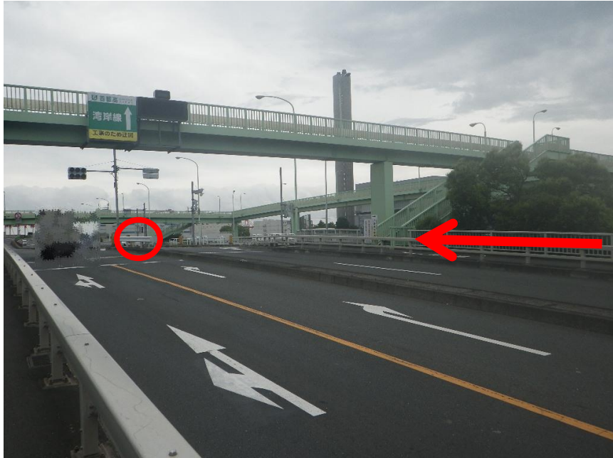
③先に進むと陸橋があるので、反対側まで渡ります。