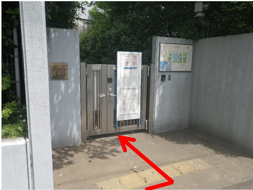
⑥しばらく直進すると左手に通用門があります。こちらからお入りください。