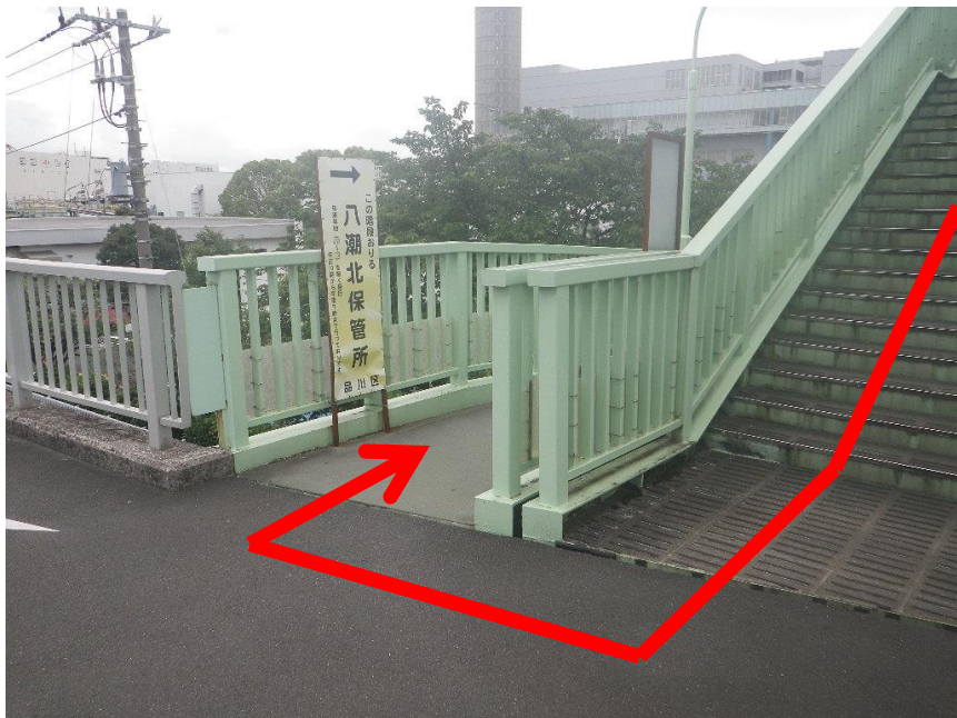
④下りた先にまた階段があるので、下りてください。