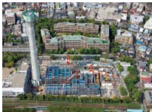
【建設工事全景(杉並清掃工場)】