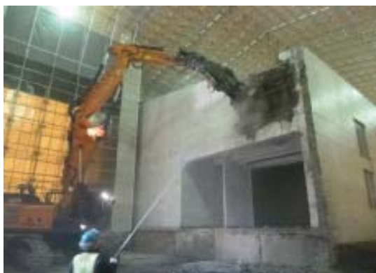
【解体工事(光が丘清掃工場)】