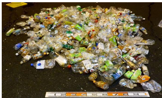
ペットボトル（産廃）の大量搬入