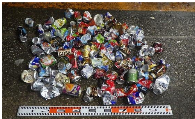
缶（焼却不適物・産廃）の大量搬入