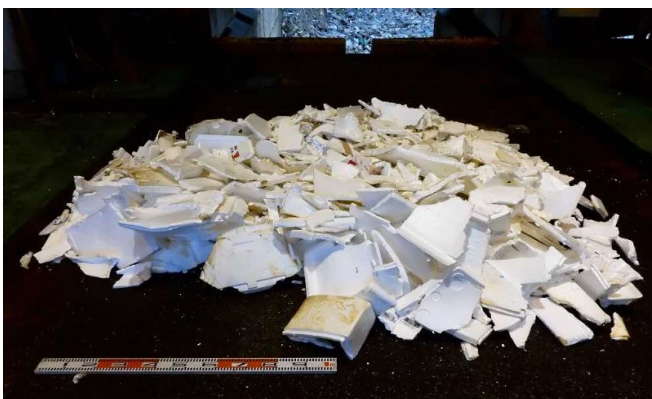
発泡スチロール（産廃）の大量搬入