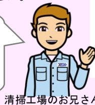
清掃工場のお兄さん

上昇したテールゲートの下に入ることは大変危険です。やむを得ず入るときは、安全棒等の安全装置を必ず使用してください。