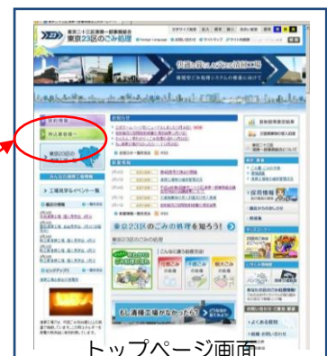
トップページ画面

http://www.union.tokyo23-seisou.lg.jp/index.html