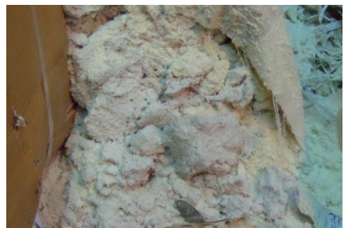
粉末状廃棄物(紙粉)