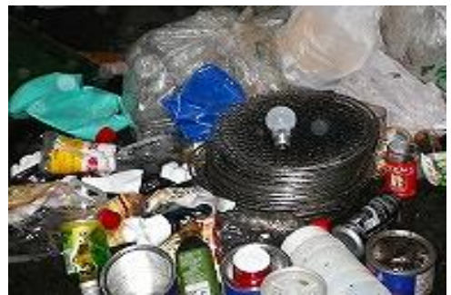
産業廃棄物(缶・金網・廃プラ容器等)