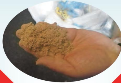
粉末状または顆粒状のもの(土など)