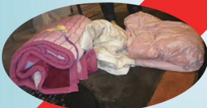
既定の寸法を超えるもの(布団など)