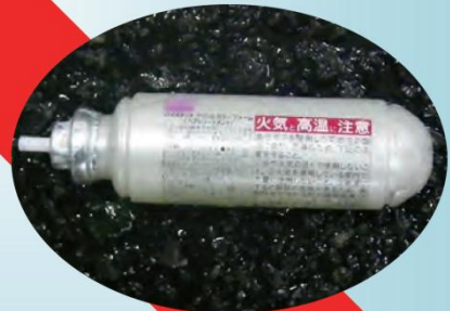
爆発性のあるもの(スプレー缶など)