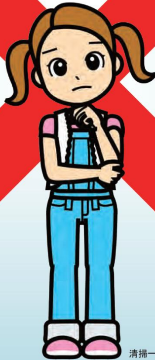
清掃一組キャラクター くみちゃん