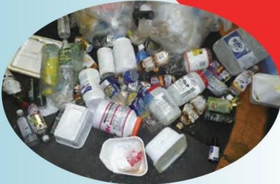
産業廃棄物 (事業活動に伴って生じた廃プラスチック類、ビニール類などは産業廃棄物になります)