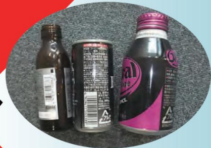
不燃物(金属、ガラスなど)