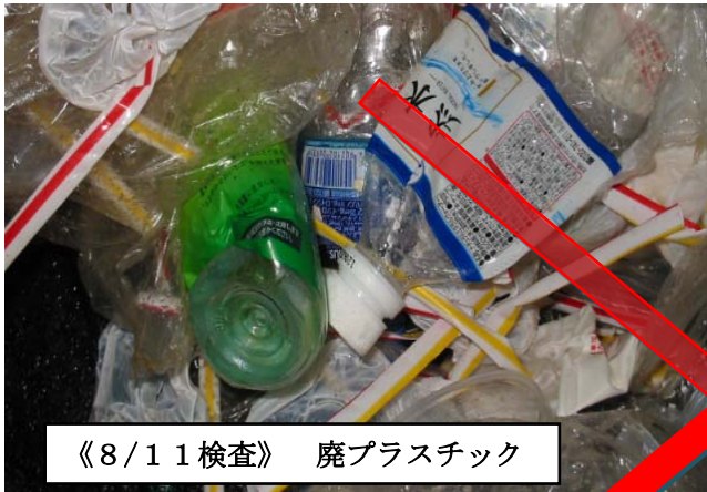
《8/11検査》 廃プラスチック