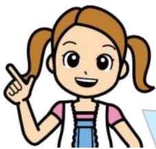
清掃一組キャラクター くみちゃん