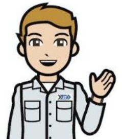
清掃一組キャラクター 清掃工場のお兄さん

持込みとは、事業者が、事業活動に伴って東京23区内で発生した事業系一般廃棄物を、自ら運搬又は一般廃棄物収集運搬許可業者に委託して、清掃工場及び中防処理施設へ搬入することをいいます。つまり、 持ち込める廃棄物は、東京23区の区域内から排出される事業系一般廃棄物のみ ということ。