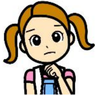
清掃一組キャラクター くみちゃん