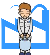
清掃一組キャラクター 清掃工場のお兄さん

世田谷清掃工場は、炉室内の作業環境測定において、ダイオキシン類濃度の上昇が確認されたため、焼却炉を停止し、原因の調査と対策を実施しています。