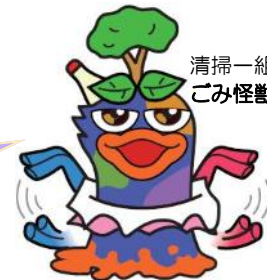
清掃一組キャラクター ごみ怪獣「カーネン」

東京23区外での剪定作業等によるごみは、特に注意！ 詳しいことは、排出場所の市町村に問い合わせるガオー！