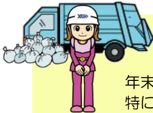
清掃一組 キャラクター くみちゃん