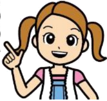
清掃一組キャラクター くみちゃん

※この場合、中央(工)は27年度から計画がないため、搬入可能量が2tであっても4/1(水)以降は搬入できません!