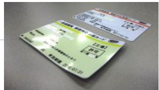
写真:【手前】曲がったカード、【奥側】正常なカード

継続持込承認カードは お配りしているハードケースに入れたまま使用 して、大切に取扱ってください。