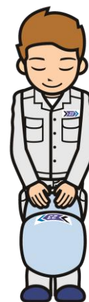
清掃工場のお兄さん