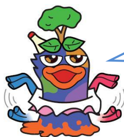
清掃一組のキャラクター カーネン

清掃工場は毎日稼働しているから、日々の点検だけでは確認できないところがあるガオ。