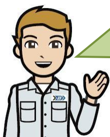
清掃工場のお兄さん

※有明清掃工場の1号炉は延命化工事のため、点検等とは別に5月から10月まで停止します。