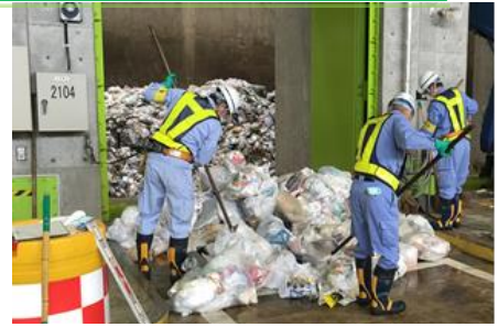
搬入物検査の様子

なお、プラットホーム入口付近で、検査をお願いしたあと、検査員が車両誘導を行います。プラットホーム内での安全確保のため、運転手側の窓を開けていただき、検査員の声が聞こえる体勢で検査を受けてください。