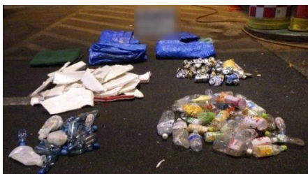
ブルーシートとペットボトルなど

多量の産業廃棄物の混入など、搬入状況があまりにも悪い場合は、搬入に至った経緯の報告やその状況の改善計画書を求めることがあります。その場合、改善計画書に従って搬入状況の改善が確認できるまで搬入物検査を強化し継続して実施します。その検査に要する時間は、毎回、1時間30分から2時間程かかります。