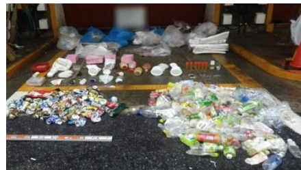
多量の缶とペットボトルなど