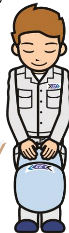
清掃工場のお兄さん