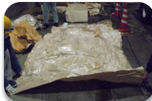
養生シート (産業廃棄物)

左の写真のような、受入基準を超えるサイズのごみや、産業廃棄物は清掃工場に持ち込めないよ！