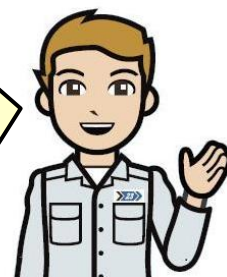
清掃工場のお兄さん

また、年末年始期間は持込ごみの増加が予想されます。ごみ伝票で超過搬入と表示されていても、ホームページにてお知らせしている搬入先工場であれば、 一時的な超過搬入を認めています。 （ただし、著しく計画量を超過する場合は、事前にご相談ください。）