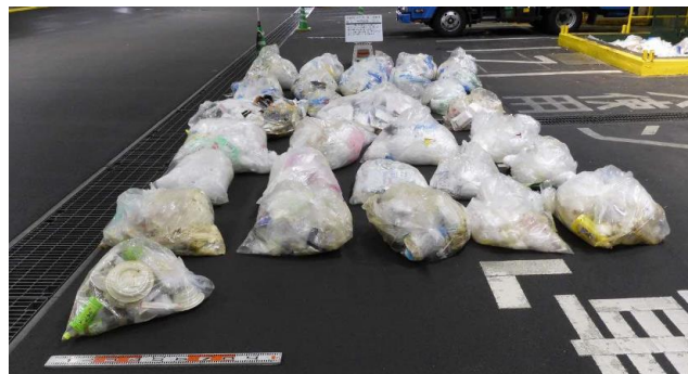
【廃プラスチック類】 食品トレイ