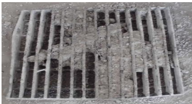
【金属くず】 グレーチング（格子蓋）

清掃工場及び中防処理施設（以下「一組施設」といいます。）では搬入物検査を実施していますが、受入基準に該当しない形状・寸法の廃棄物や産業廃棄物の搬入が増えています。