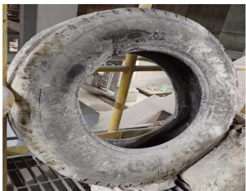
【廃プラスチック類】 自動車用タイヤ