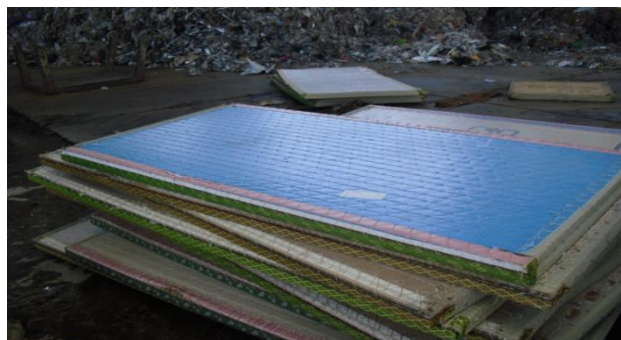
【廃プラスチック類】 建材畳床（スタイロ畳）