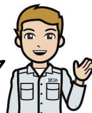
清掃工場のお兄さん