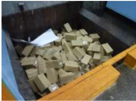
工場のバンカに投入されていた ワクチンシール