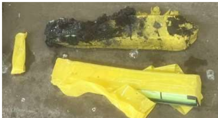
発火原因の二次電池（黄色テープで絶縁処理済）