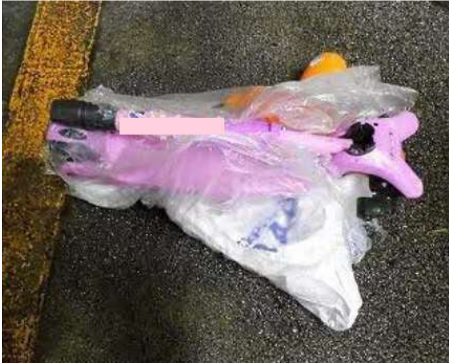
袋に入った状態のキックボード