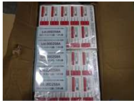
未使用のワクチンシール