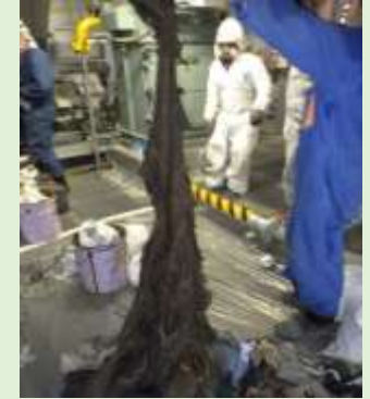
焼却しきれずに残った布のかたまり