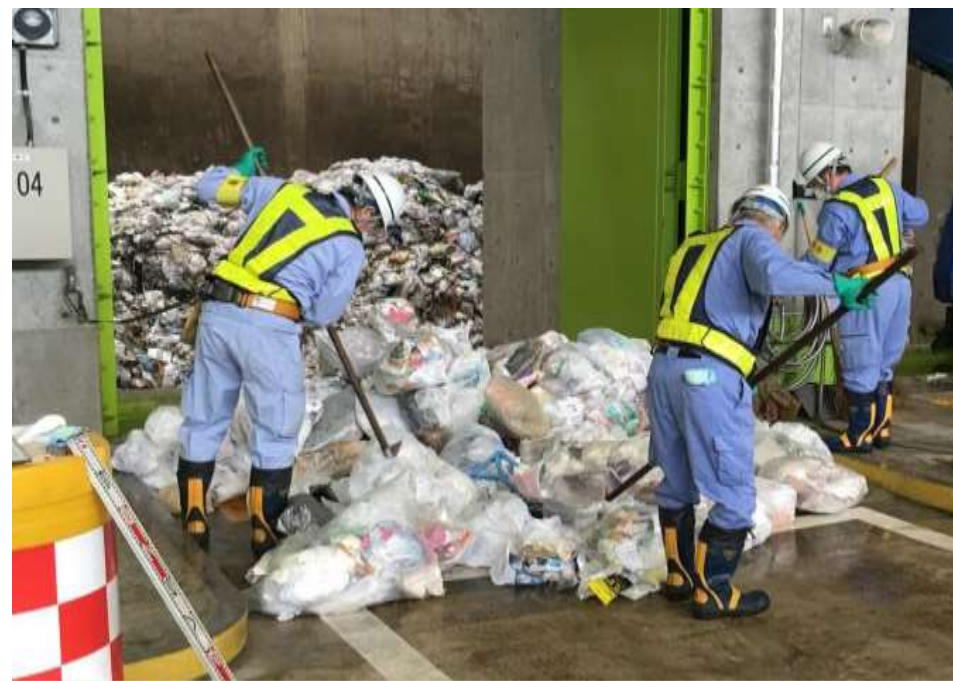
不適物の有無の確認