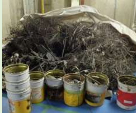
焼却炉から摘出された不燃物