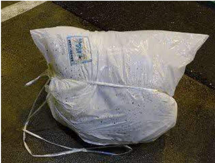
袋に入った状態のクッション