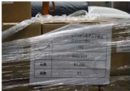
外箱にモデルナ製ワクチンの記載