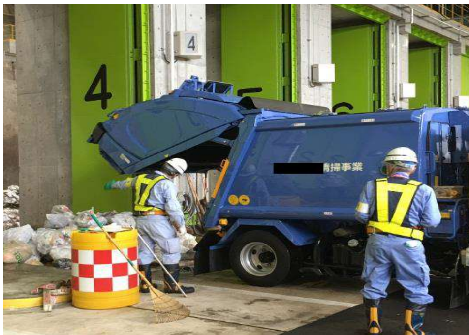
検査サンプルの確保