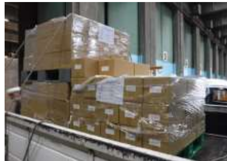
ワクチンシールの箱が大量搬入