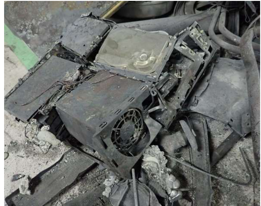
デスクトップパソコン