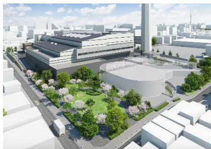
開放的な緑地空間

トップライトによる自然採光や自然通風を利用することにより、消費電力を削減します。また、再生可能エネルギーである太陽光発電設備を設置します。