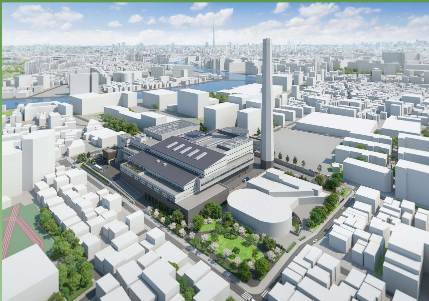
新工場イメージ図