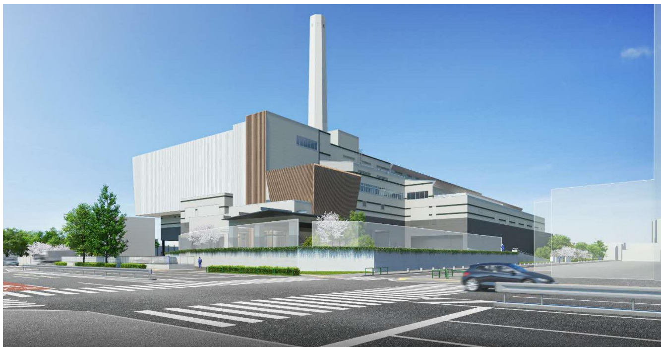
北東側から見る工場イメージ