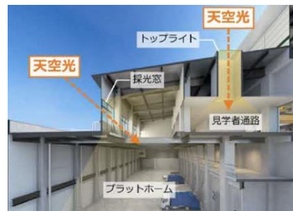
自然採光の有効利用