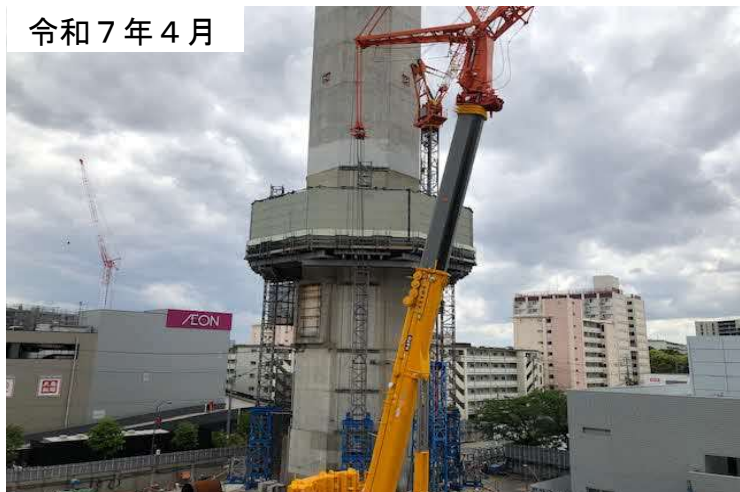
煙突ワークステーション（作業場）設置の様子