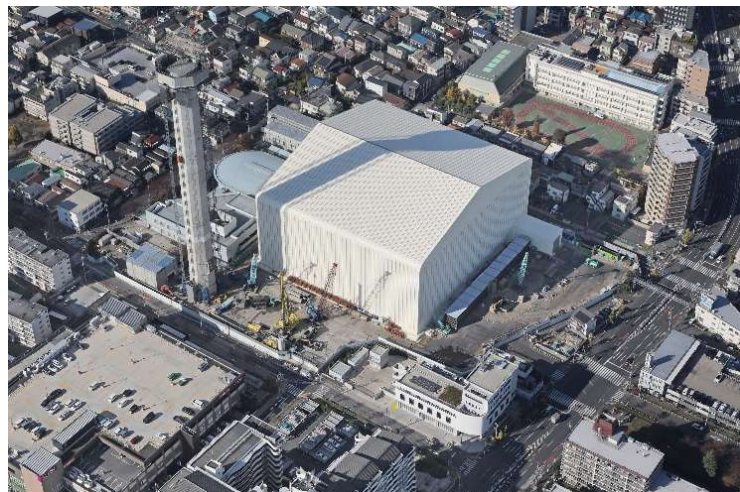
令和7年11月 航空写真（南東側）