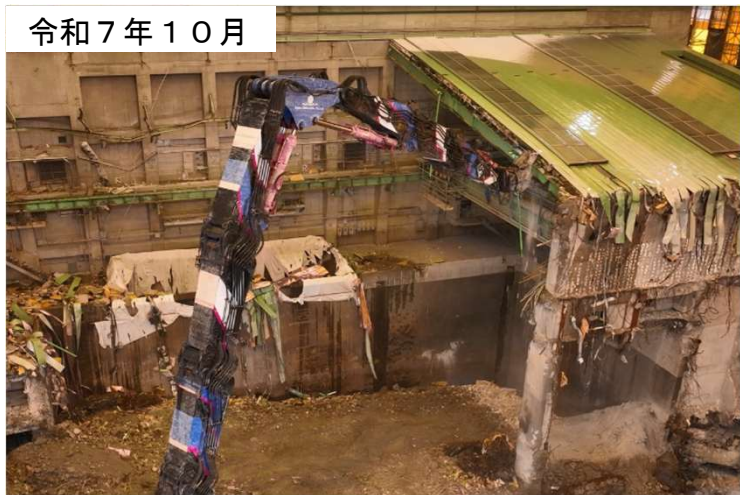
テント内での解体の様子