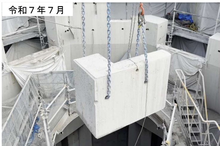
煙突外筒コンクリートを小割した様子