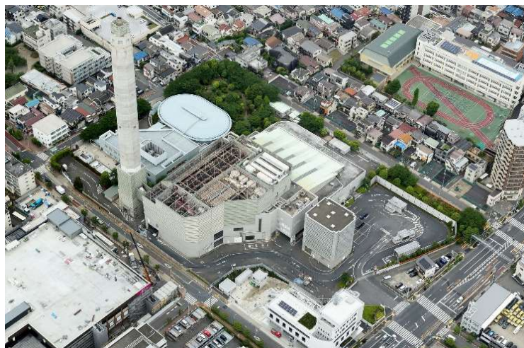
解体工事着手前（令和5年） 航空写真（南東側）