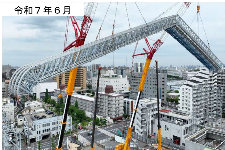
テントフレーム組立の様子