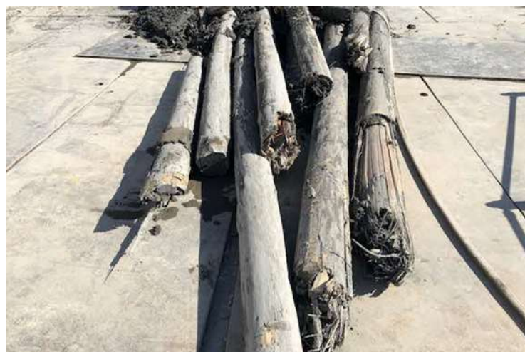
地中障害物として発見された木杭