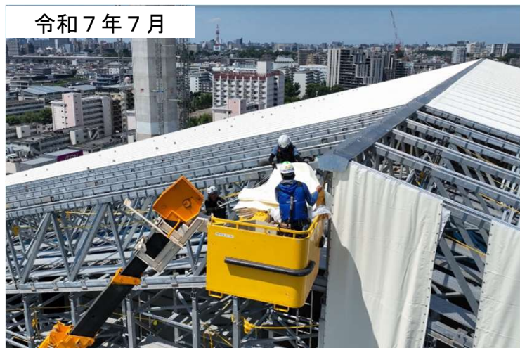
テントシート材設置の様子