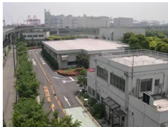
品川清掃作業所（品川区八潮 1-4-11）