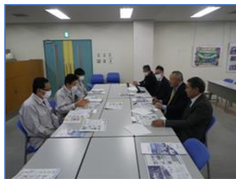
ごみ処理について意見交換