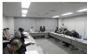
公害対策委員会の様子

令和6年2月29日(木)に「足立清掃工場運営協議会 公害対策委員会」を開催しました。委員の皆様には事前に資料を送付し、「環境調査結果」について報告しました。