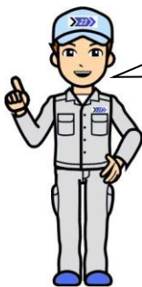
清掃工場のお兄さん