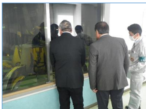
ごみクレーンの説明

令和6年1月16日（火）、チリ共和国サンペドロ・デ・アタカマ市長が足立清掃工場に来場されました。アタカマ市は人口に対して観光客が多く、ごみを埋め立てして処理しているが、埋立地の確保に苦勞されているとのこと。工場見学のほか、特別区のごみ処理システムについて説明を受け、意見交換を行いました。