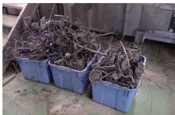
清掃で取り除いた焼却に適さない金属類