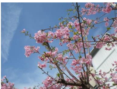
今年も枝いっぱい咲きました