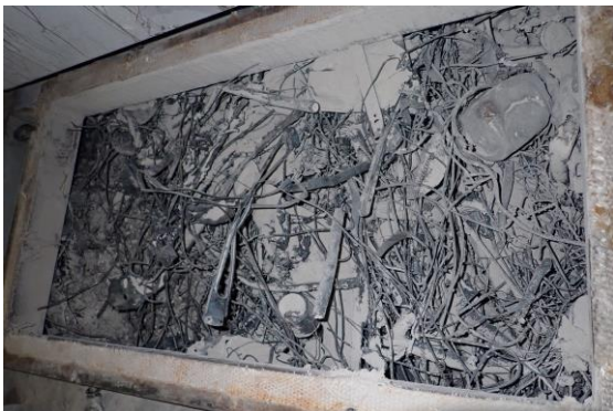
灰搬送装置清掃前の詰まり状況(点検口正面)

ごみの適切な分別が清掃工場の安全で安定的な稼働につながります。皆様のご協力をお願いします。