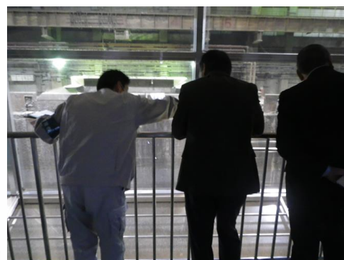
ごみバンクの説明