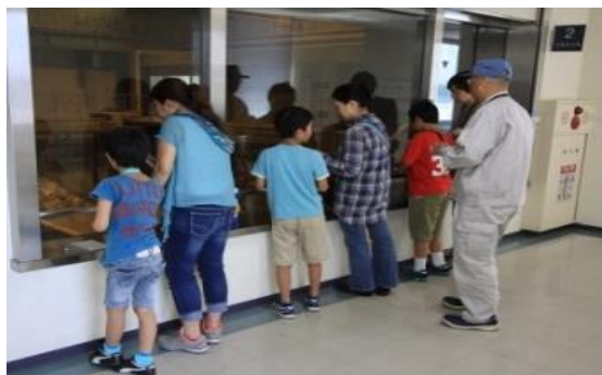
<工場見学会の様子>