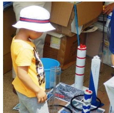
<煙突わなげを楽しむ様子>

今年も清掃工場PRコーナー（テント）において、「スマート資源分別ゲーム」や「煙突わなげ」などの体験型の展示を行う予定です。夏休みの思い出として、ご家族皆さまで、ぜひご来場ください。お待ちしております。