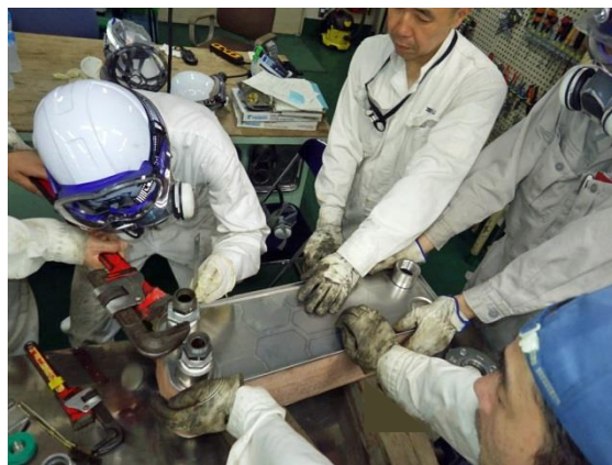
<劣化部品交換の様子>

清掃工場では、毎年決まった時期に焼却炉を停止し、プラントの健康診断を行います。軽いものはすぐに修理し、重大なものは半年後の焼却炉の補修工事で改修を行い、健康な状態を取り戻して、安全で安定した稼働を目指しています。