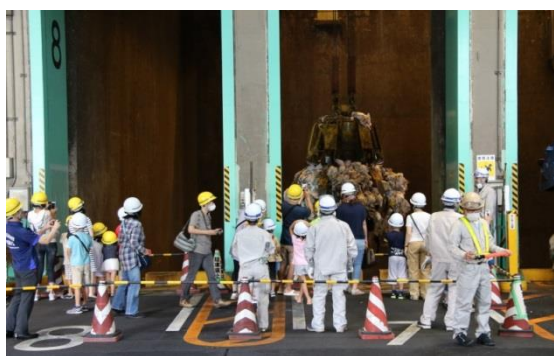
<親子施設探検隊の様子>