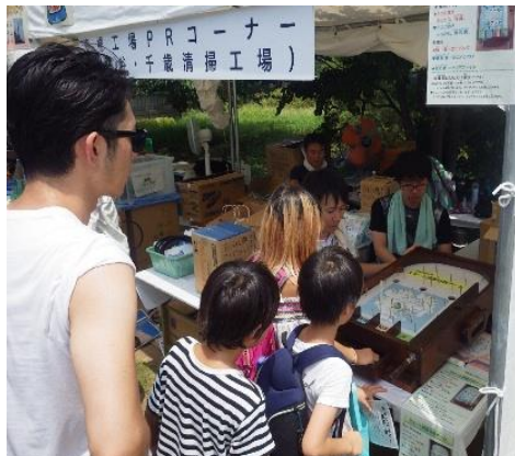
<スマート資源分別ゲームを楽しむ様子>

夏空の下、毎年恒例の「せたがや区民まつり」が8月3日（土曜日）・4日（日曜日）に開催されます。千歳清掃工場は世田谷清掃工場と合同で、この区民まつりに出展いたします。会場は、世田谷区役所周辺と若林公園で開催されます。