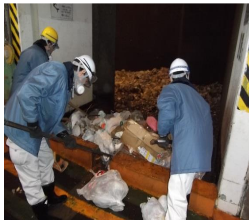
<ごみの搬入物検査の様子>