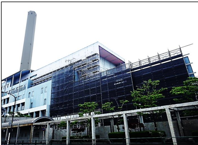
＜足場を組み、飛散防止シートで被う様子＞