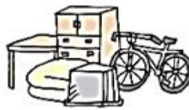
そだい 粗大ごみ (大きなごみ)