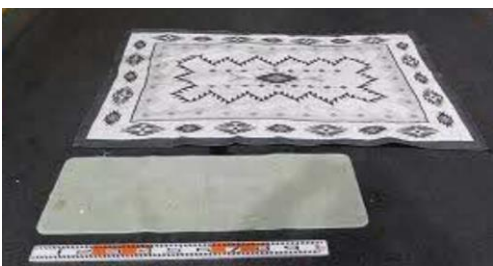
カーペット (粗大ごみとして分別してください)

焼却炉が停止すると、復旧のために多くの費用や日数がかかるだけでなく、ごみの収集が遅れる原因にもなります。ごみを出す前の適正な分別が重要です。区民・事業者の皆さまのご協力をお願いいたします。