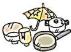
ふねん 不燃ごみ (燃やさないごみ)