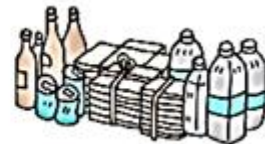
しけん 資源 (しんぶん ざっし 新聞・雑誌・びん・ かん 缶・ペットボトルなど)