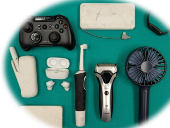
充電式電池内蔵製品（一例）