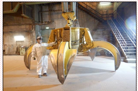
【迫力ある「ごみクレーンバケット」】

https://www.union.tokyo23-seisou.lg.jp/kengaku/index.html