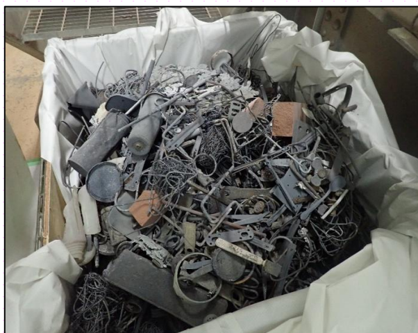
【機器の中で絡まった金属などの不燃ごみ】