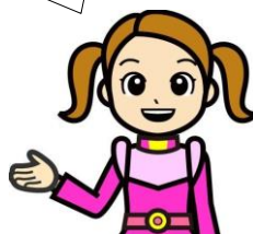
清掃一組キャラクター くみちゃん