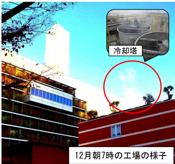
12月朝7時の工場の様子

気温が低い時期に、屋上から工場内を循環する水(冷却水)が「湯気」となって見えることがあります。