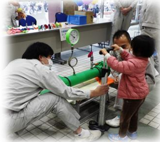
～作業体験コーナー～