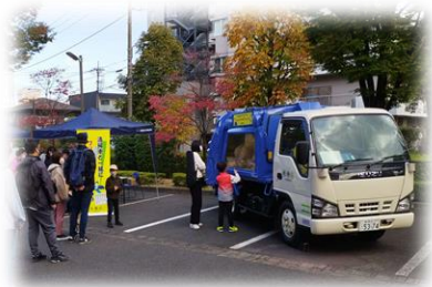
～ごみ収集車とプリクラ撮影～