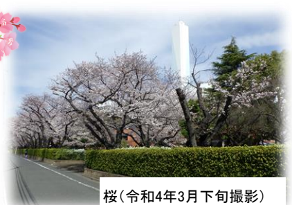
桜(令和4年3月下旬撮影)