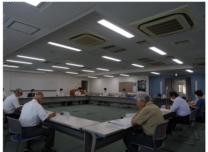
〈運営協議会の様子〉

今回は、ごみの搬入量及び焼却量、発電状況など工場の操業状況と、排ガス、ダイオキシン類などの環境調査結果、放射能等測定結果について報告を行いました。