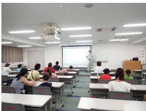
<写真:左・右 個人見学会の様子>