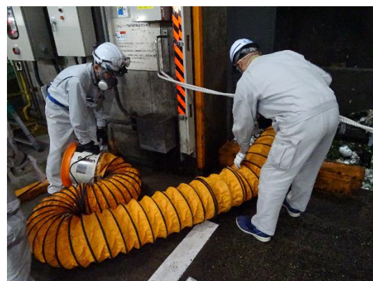
〈写真：転落者救助訓練の様子〉