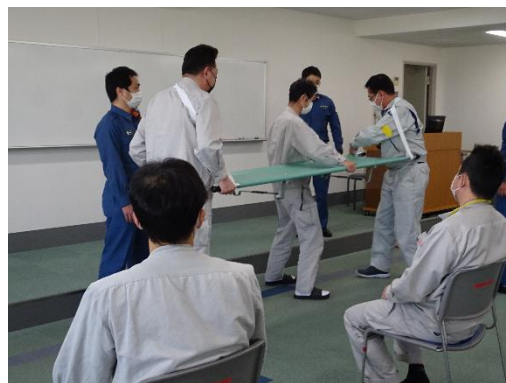
〈写真：止血・搬送訓練の様子〉

令和4年5月11日（水）、金町消防署水元出張所の協力により、見学者や職員が出血などした場合に備え「止血・搬送訓練」を行いました。