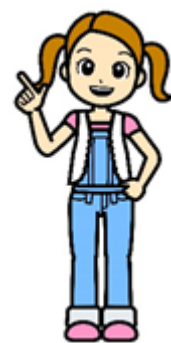
清掃一組キャラクター くみちゃん

◎なお、当組合ホームページでは、工場見学案内動画「清掃工場へようこそ（15分程度）」をご覧いただけます。（日本語版、日本語対応手話、英語版、中国語版、韓国語版があります。）