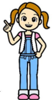
清掃一組キャラクター くみちゃん

◎当組合ホームページでは、工場見学案内動画「清掃工場へようこそ（15分程度）」をご覧いただけます。（日本語版、日本語対応手話、英語版、中国語版、韓国語版があります。）