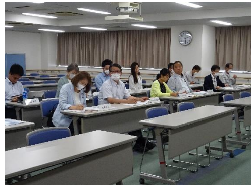
〈見学者説明室での様子〉

はじめに、見学者説明室で工場の概要の説明を受けた後、プラットホーム、中央制御室、ごみバンカとごみクレーンなど、工場内各施設を見学しました。