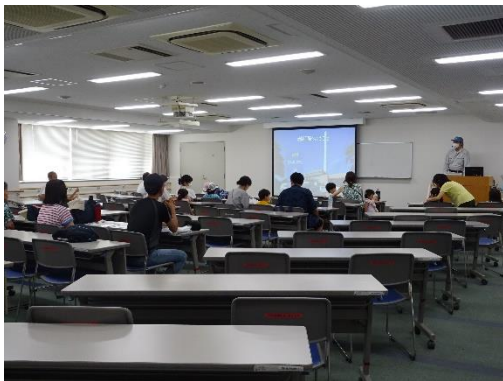
<写真:左・右 個人見学会の様子>