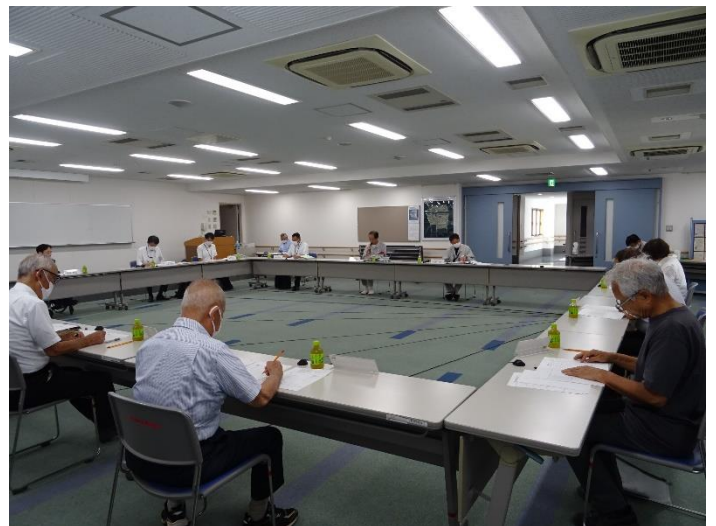
〈運営協議会の様子〉

なお、運営協議会の資料は、東京二十三区清掃一部事務組合ホームページに掲載しています。 https://www.union.tokyo23-seisou.lg.jp/kojo/katsushika/index.html