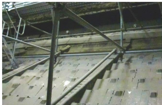
(写真上) 焼却炉の内部です。足場を組んで、内部の清掃や点検補修などを行います。

(写真右) 2月下旬のごみバンカの様子です。 左側の柱の間から、ごみが投入されます。