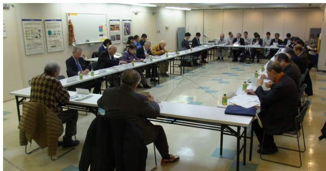
(第41回運営協議会の様子)

年末の慌ただしい中、各委員の皆様にはご参加いただきまして、誠にありがとうございました。