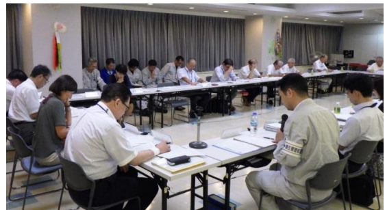
(第42回運営協議会の様子)

※運営協議会の資料は、東京二十三区清掃一部事務組合のホームページでご覧になれます。