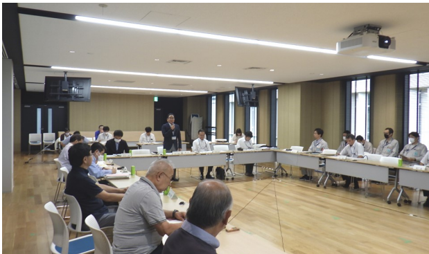
運営協議会の様子