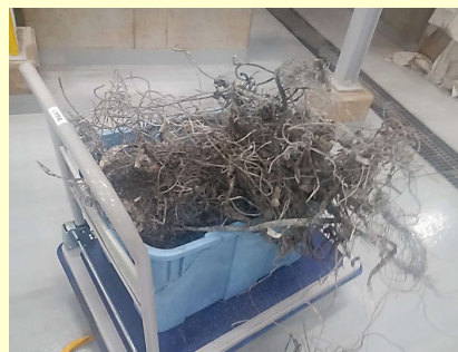
絡まっていた金属類