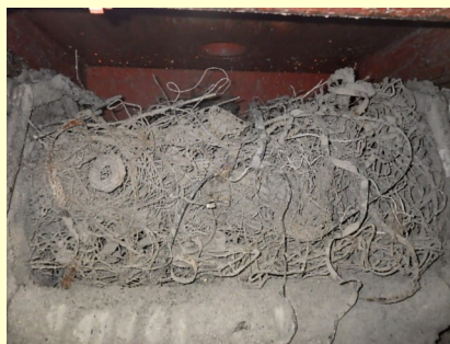
灰コンベヤ内の絡まり・閉塞状況