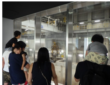
ごみバンクの見学

令和6年8月17日（土）に「親子見学会」を開催しました。目黒清掃工場建替後初めての開催となりましたが、41名もの方々に参加していただきました。当日は通常の工場見学に加え、スタンプラリーやはたらく車の乗車体験を行ったほか、目黒区と連携して、ごみの積み込み体験を行いました。今後もこのようなイベントを通して、地域に親しまれる清掃工場を目指していきます。