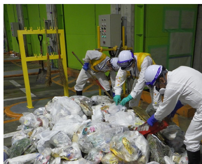
搬入物検査の様子

令和6年7月23日（火）の検査では一部の車両から電気カーペットやACアダプター、空き缶などの不適正ごみが見つかりました。これらのごみは焼却炉の停止につながり、ごみの収集に影響を与える可能性があります。ごみの適正な分別にご協力をお願いします。