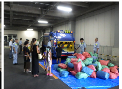
ごみの積み込み体験