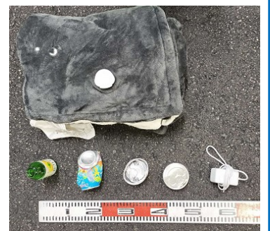
見つかった不適正ごみ (電気カーペット、空き缶など)