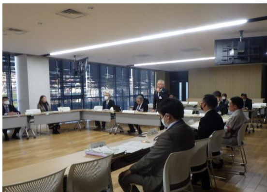
運営協議会の様子