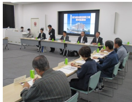
運営協議会の様子