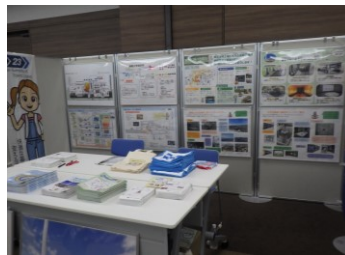
パネル展示の様子

清掃工場のブースでは清掃工場のしくみ等のパネルを展示し、約600名が訪れました。