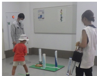
煙突輪投げ、入るかな?

工場見学や煙突輪投げコーナーの他、練馬区のご協力でスケルトン車を使ったごみの積込み体験が行われました。