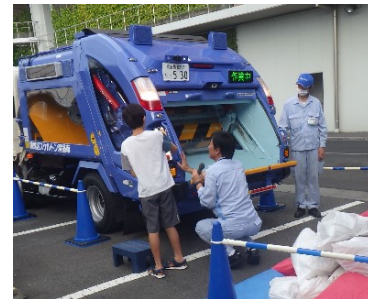
スケルトン車で積込み体験