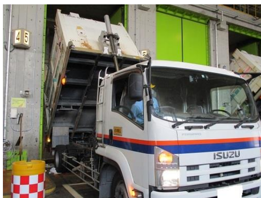
③ ごみバンカへ投入します