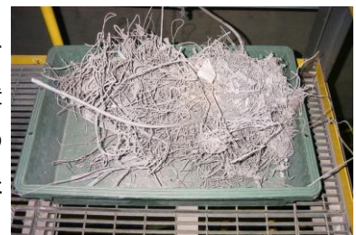
清掃工場の機械に詰まった金属類

可燃ごみの中に電気コードやビニール傘、針金ハンガーなど金属類が混ざっていると、焼却炉の停止や故障の原因となります。焼却炉の停止や設備の故障は、復旧に多くの費用と時間を要するだけでなく、ごみの収集が遅れるなど区民の皆さまの生活に多大な影響を及ぼすこととなります。ごみの分別を正しく行っていただきますよう、区民・事業者の皆さまのご協力をお願いいたします。