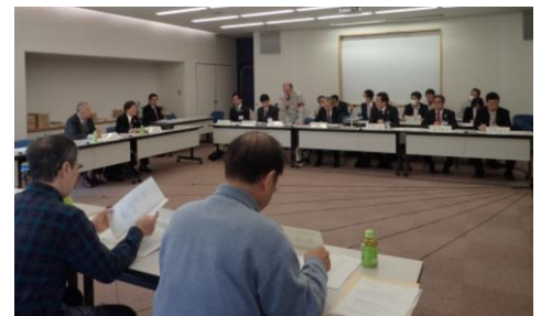
運営協議会の様子

平成 30 年 3 月 13 日（火）に、第 36 回運営協議会を地域住民代表委員、渋谷区委員及び東京二十三区清掃一部事務組合委員の出席のもと開催しました。運営協議会では、①操業状況、②環境調査結果 についての報告を行いました。また、渋谷清掃工場の放射能等測定結果についての説明も併せて行いました。なお、煙突からの排ガス及びダイオキシン類の調査結果については、下表のとおりです。