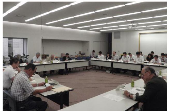
運営協議会の様子

なお、煙突からの排ガス及びダイオキシン類の調査結果については、下表のとおりです。