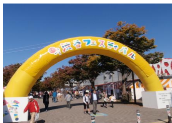
フェスティバル会場入口