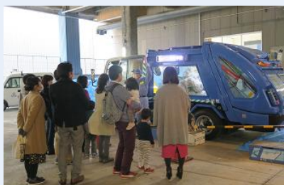
スケルトン車でごみ収集車の構造を学びました。