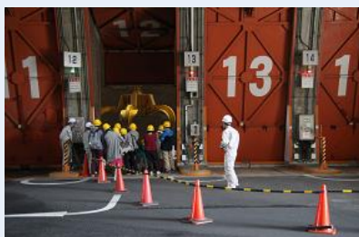
ヘルメットを被ってプラットホームを見学しました。