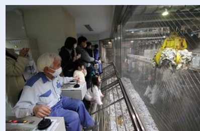
特別にクレーン操作室にも入り見学しました。