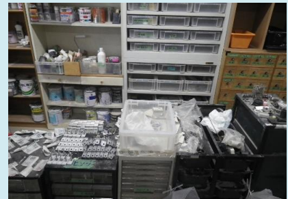
塗装に必要な塗料や交換部品が用意されています