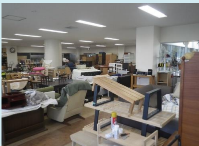
室内には所狭しと家具が置かれています

このように、品川清掃工場は可燃ごみの焼却施設というだけでなく、品川区が行う資源の有効活用事業に貢献している施設であるという一面もあります。