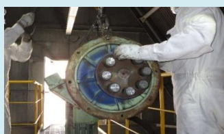
低圧蒸気復水器ファン電動機 取外し作業の様子

品川清掃工場は、これからも安全で安定的な工場運営を目指し、点検・整備を計画的に進めてまいります。