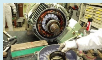
低圧蒸気復水器ファン電動機 分解整備作業の様子