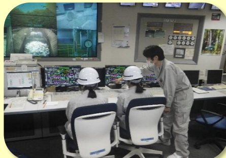
中央制御室での 運転監視業務