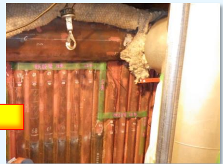
新管取替前（炉外側）