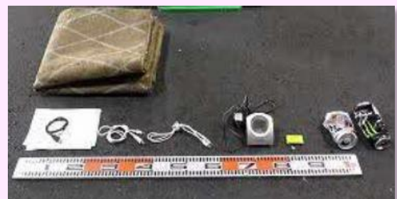
搬入物検査で見つかった不適物

【品川区のごみの分別方法についてのお問合せ先】 品川区清掃事務所 品川庁舎 03-3490-7051 荏原庁舎 03-3786-6552