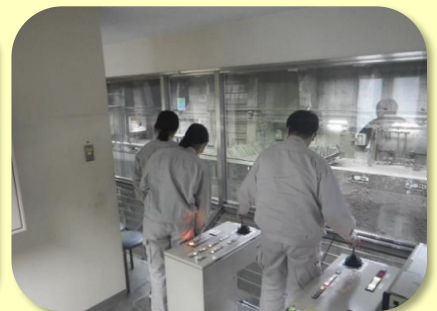
ごみクレーン 操作の見学