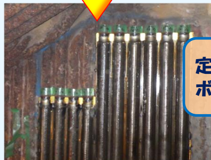
新管取替後（炉内側）