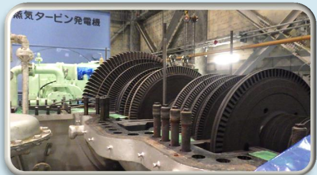
写真② タービン開放点検の様子