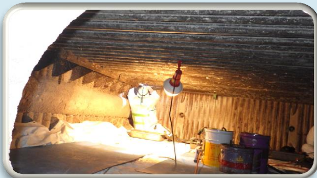
写真① ボイラ設備配管補修の様子

品川清掃工場は、これからも安全かつ安定的で効率的な清掃工場の管理運営を推進してまいります。