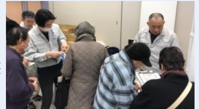
品川清掃工場ブースの様子