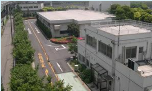
品川清掃作業所外観

品川清掃作業所は、品川清掃工場に隣接する、東京23区で唯一のし尿等の下水道投入施設です。この施設では、し尿等を固液分離、脱水等を行い、きょう雑物を取り除き、排水は水質を下水排除基準以下まで希釈し下水道に投入しています。希釈水は清掃工場の排水を再利用しています。固形の可燃物については清掃工場へ運搬し焼却処理、不燃物は埋立処分しています。