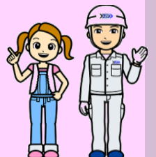
くみちゃんとお兄さん 清掃工場のお兄さん