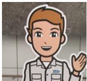
清掃工場のお兄さん