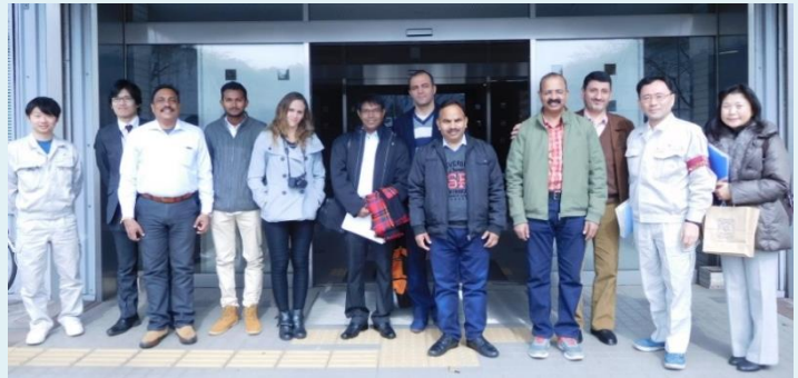
環境省 循環産業研修の様子