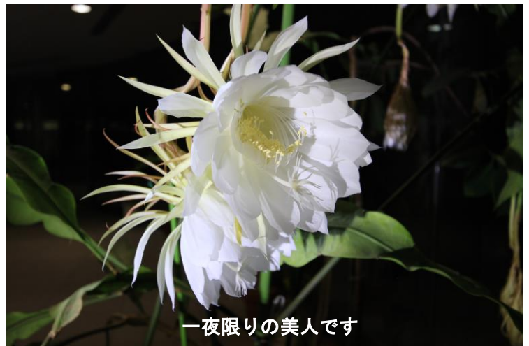
一夜限りの美人です