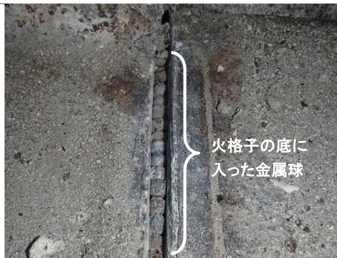
火格子の底に入った金属球

ごみは、正しい分別方法で出していただきますよう、皆様のご協力をお願いいたします。