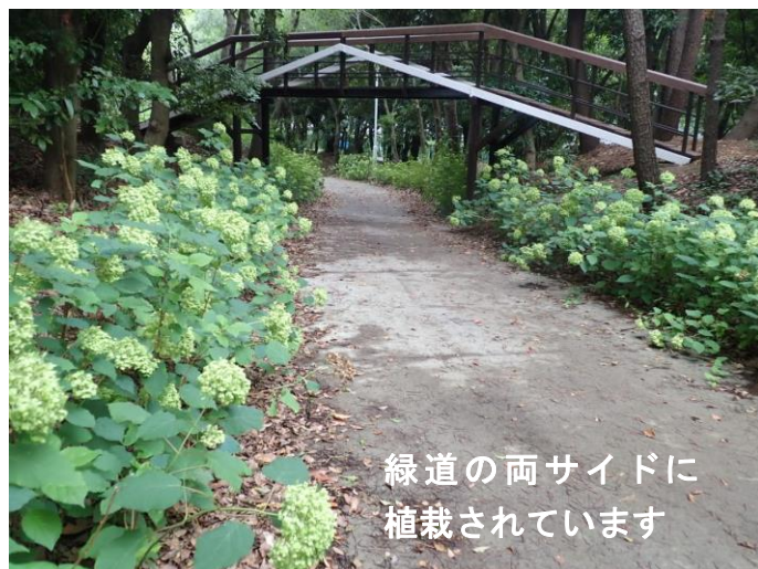
緑道の両サイドに 植栽されています