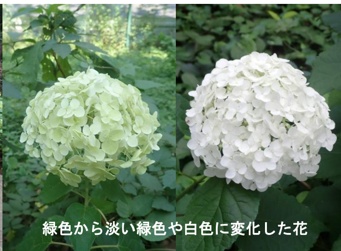
緑色から淡い緑色や白色に変化した花

新木場駅から当工場に向かって延びる夢の島緑道公園には、アジサイの一種「アナベル」がたくさん植えられ、通行する人の目を楽しませてくれます。6月頃から開花し、最初は緑色の花をつけますが、淡い緑色や白色に変化する花が出てきます。開花期間が非常に長く、今年は梅雨の影響もあったため、7月末まで咲き続けていました。